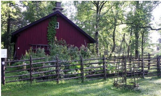
Pilgrimshärbärge finns i Forshem (bilden) och Österplana. Raststuga vid Oxlebacken på Österplana vall.

Hör med de lokala aktörerna/turistbyråerna.