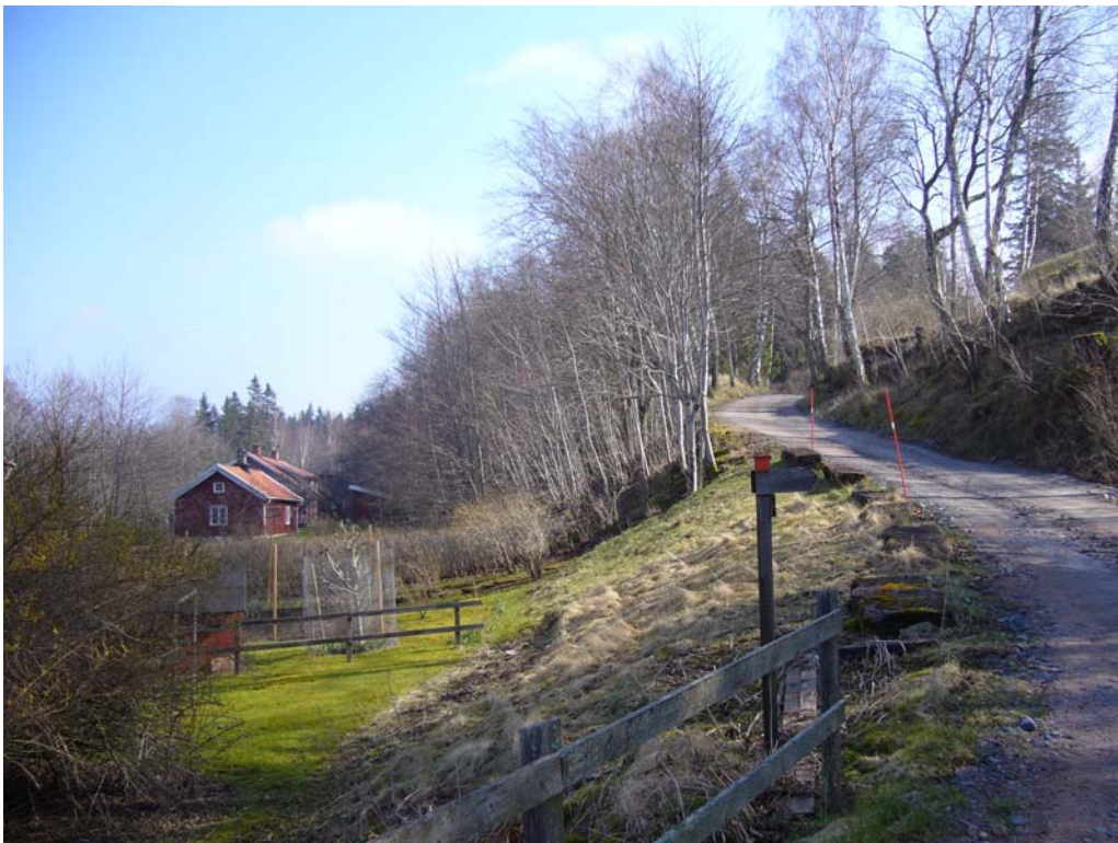
Den branta entrévägen till hamnområdet

Området består av dels en strandzon på lägre nivå innefattande hamnen, stenmuseet och tre av bostadshusen. Ner till strandzonen går en mycket brant sluttande angöringsväg som idag ej kan nyttjas av besökare per bil eller buss. Den övre nivån c:a 15m (?) över strandområdet innehåller angöringsplats för besökande fordon i anslutning till den här belägna "gula villan".