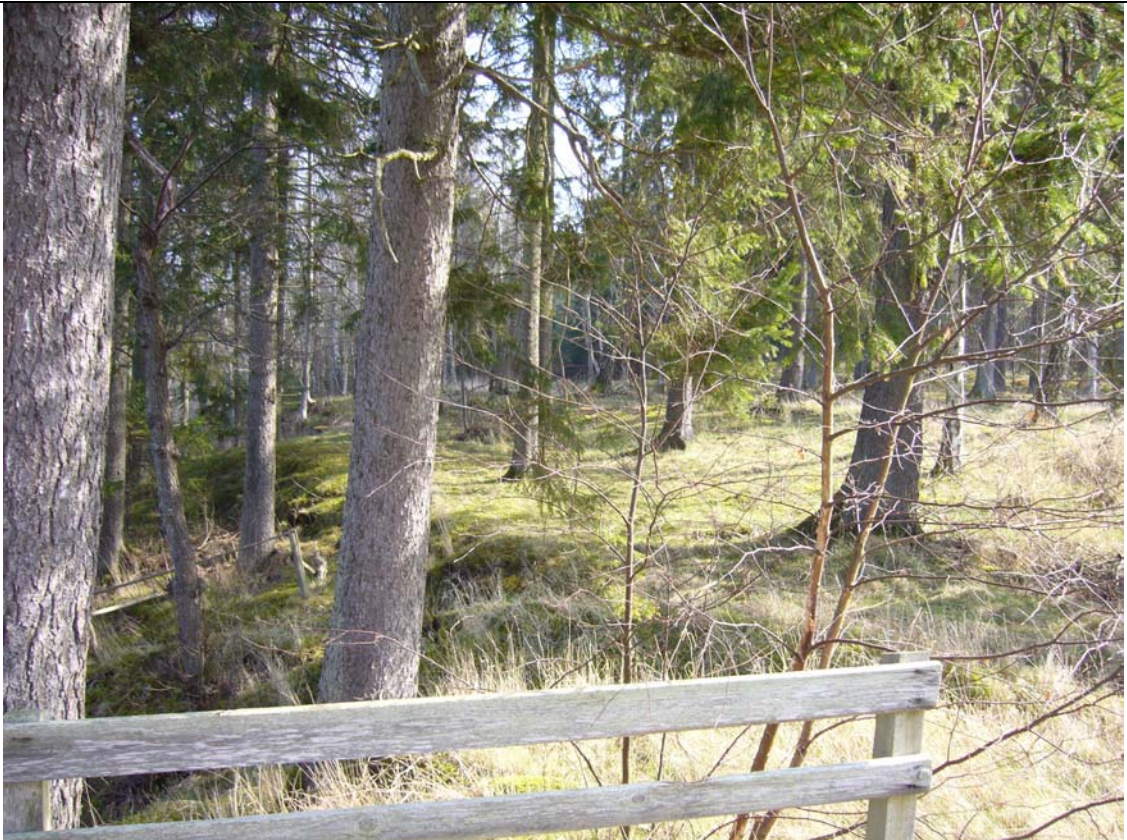
Tomtområdet för övernattningsstugor idag

Sydväst om och i anslutning till nya ”nya verkstaden” avsätts en yta för en eventuell mindre kiosk/café-servering. Dess utformning skall anpassas till omgivningen såväl beträffande byggnadens skala och material som beträffande uteserveringens omfattning och utseende. Med hänsyn till läget bör reklamskyltar och dylikt begränsas i omfattning och färg.