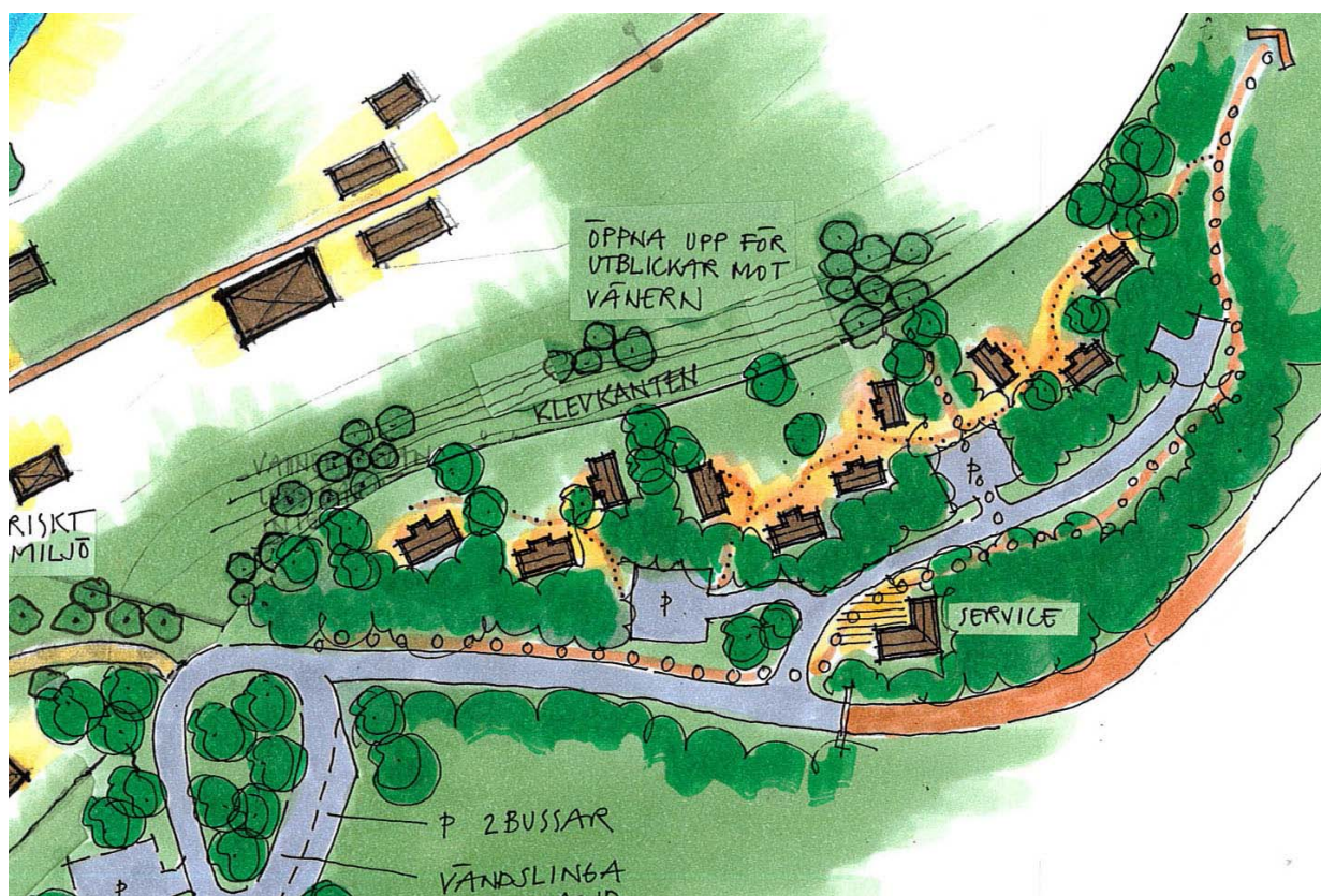
Skiss till disposition av området för övernattningsstugor

På krönet 75 meter norr om gula villan utmed skogsbilvägen mot herrgården föreslås ett område med tio övernattningsstugor och en mindre servicebyggnad samt tillhörande bilparkering. Skogsbilvägen mot herrgården kommer att stängas av för allmän biltrafik.. Sådan bil- och busstrafik sker via den enskilda vägen från sydost i riktning Trolmen.