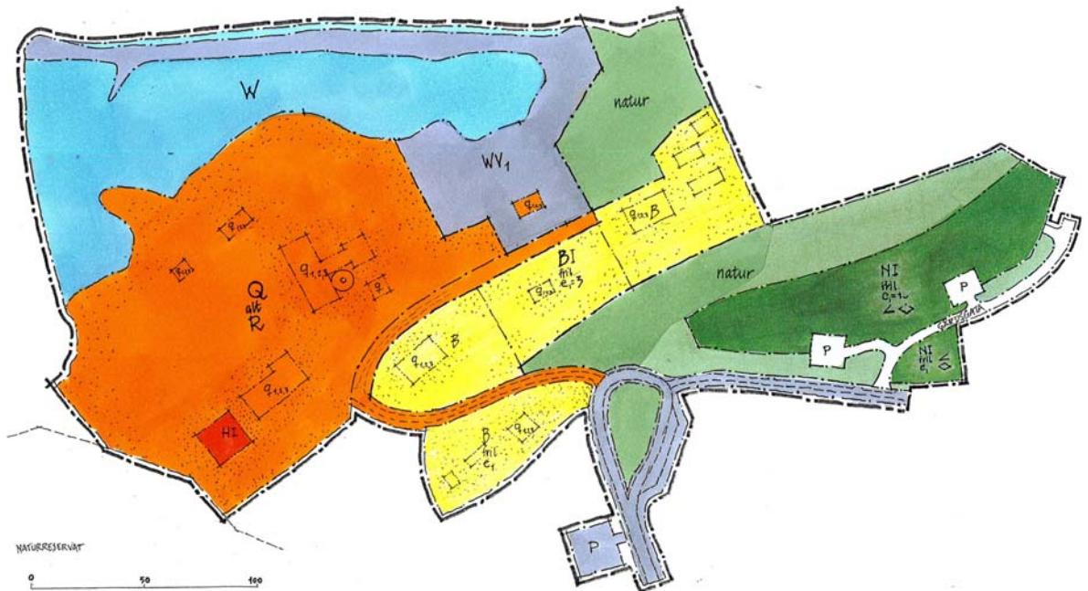
Första skiss till formell plan

Det finns inga uppgifter om förorenad mark inom planområdet. Det finns heller inga uppgifter om förekomst av radon inom planområdet.